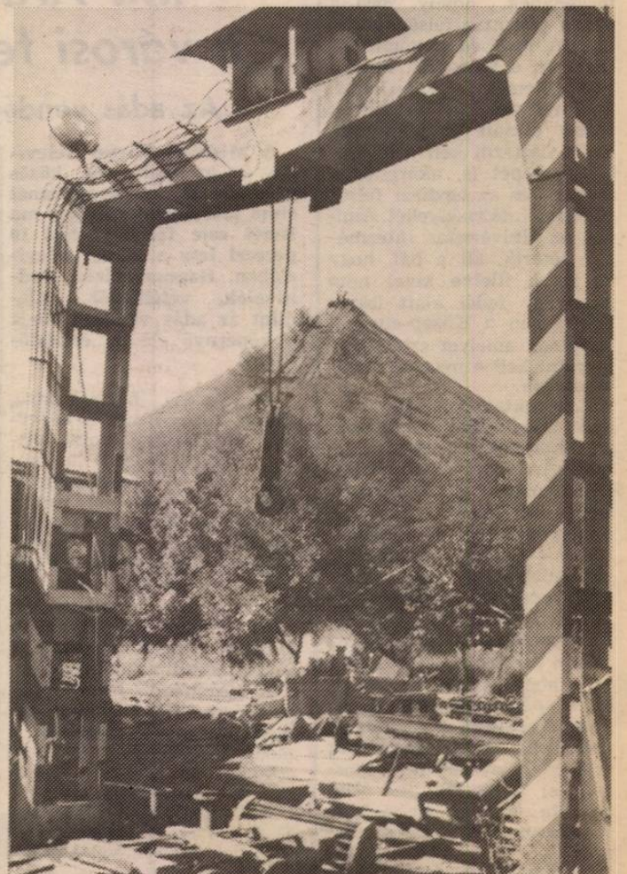
Elárvult daru a meddőhányó tövében.